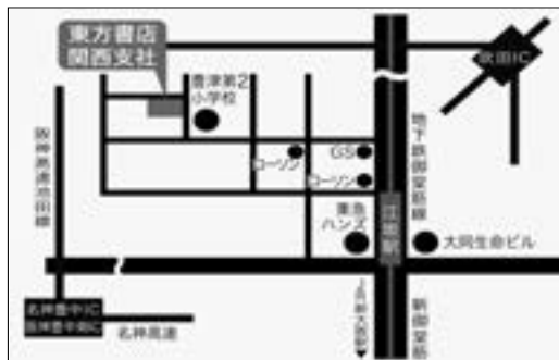
◆東方書店関西店舗アクセス図

アクセス：地下鉄御堂筋線江坂駅5号出口より徒歩5分(駐車場あり) 営業時間：[月～金] 10:00～17:30 [土日祝祭日] 休業