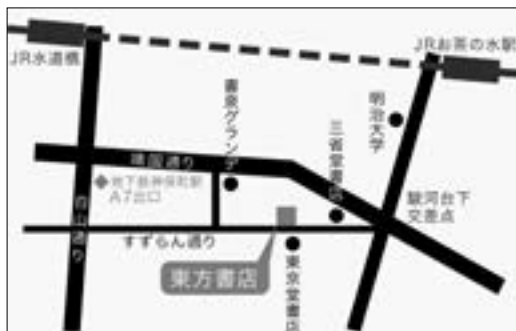
◆東方書店東京店舗アクセス図

アクセス：地下鉄半蔵門線・三田線・新宿線神保町駅A7出口より徒歩1分／JR御茶ノ水駅御茶の水橋口または水道橋駅東口より各徒歩10分 ※三省堂書店、東京堂書店を目印においでください。 すずらん通りの中ほどに位置しております。 営業時間：[月～土] 10:00～19:00 [日] 12:00～18:00 [祝祭日] 一部休業